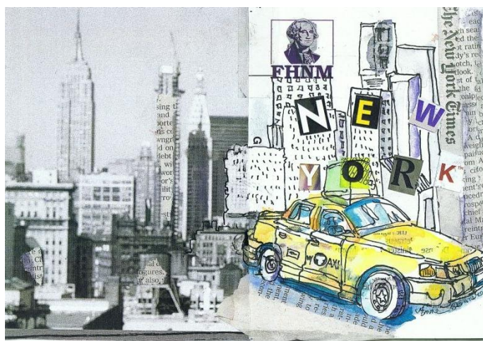
... et après un séjour à New York. DOCUMENTS REMIS